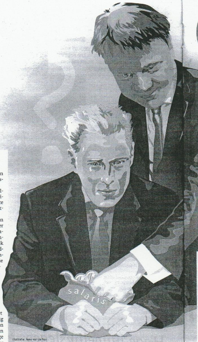
Illustratie: Nees van de Nes

'Als je geen baangarantie hebt en je wordt na een loonsverlaging alsnog ontslagen, dan heb je er dus zelf aan meegewerkt dat je minder ww krijgt. Dat kan uiteraard nooit de bedoeling zijn. Naast zo'n garantie kan het eveneens slim zijn om een versobering van je inkomen alleen te accepteren als alle andere betreffende collega's ermee ak-